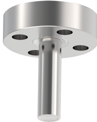
Separador para conexión bridada, modelo 990.49