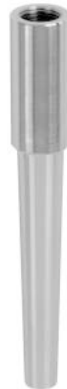
Защитная гильза, Ввариваемого типа Модель SI400S

Длина погружения U_1 + длина присоединения T